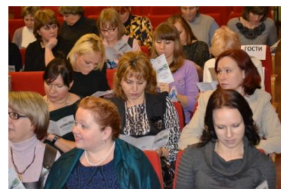
Литературно - музыкальная композиция «С чего начинается Родина»