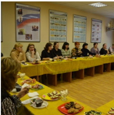
За чашкой чая были подведены итоги семинара, высказаны слова благодарности педагогам и восхищения талантам воспитанников гимназии № 7.